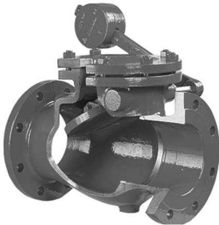
Typ GAL ( Type GAL )